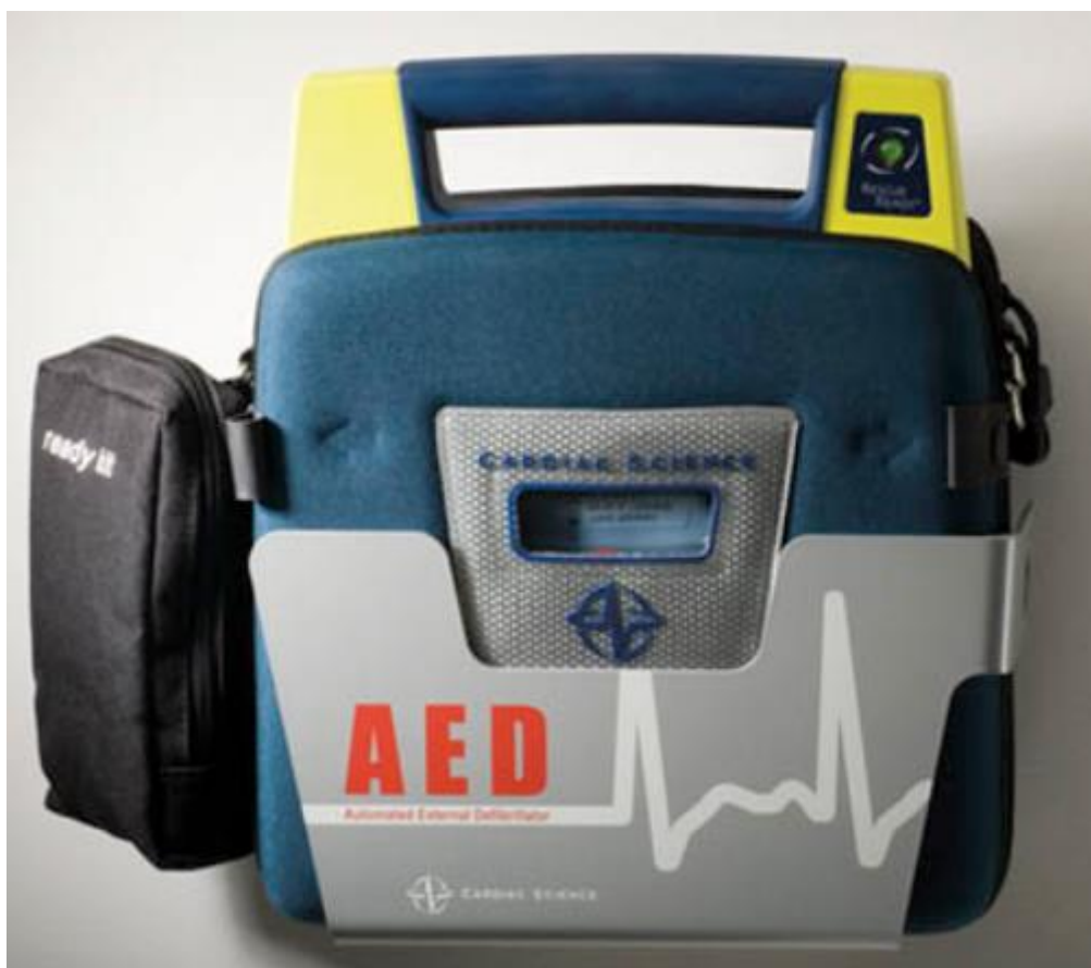
Držiak pre Powerheart G3