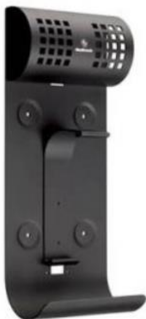
Držiak pre Lifepak CR Plus